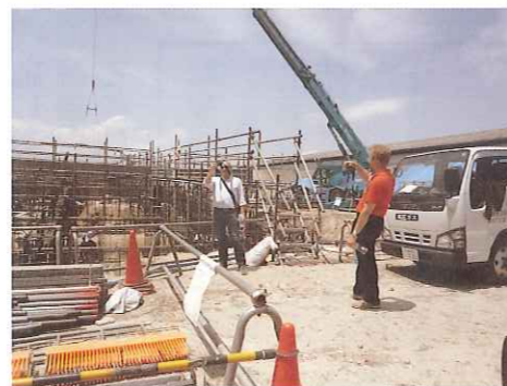
建設現場の様子 (平成23年6月22日現在)

事業報告 (抜粋) 平成22年度事業目標に対し以下の報告を致します。 (目標) 人間性のある有能な人材の確保と職員の適正を見極めた人員配置 (報告) 定期的な学校訪問、出前授業や大規模な施設見学を行い、結果新規14名の採用につながりました。 (目標) スウェーデン・リンデシェブリー市との交流によるケアの質の向上 (報告) 平成22年度は、職員3名をスウェーデンに派遣し、言葉の壁を乗り越え充実した研修を行いました。 (目標) お地蔵さま参りの計画・立案 (報告) 毎月24日をお地蔵さま参りの日と定め、利用者、地域の方と祈りをささげています。 (目標) 全職員へのコンプライアンスの徹底 (報告) 全職員参加型の研修を定期的に実施し、コンプライアンスの徹底に努めています。