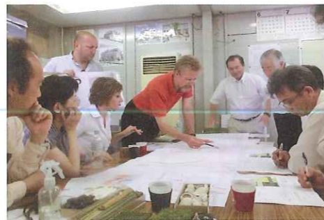
ヨーロッパのデザイナーによる説明