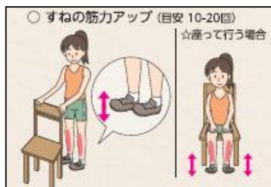
つま先を上げ下げする