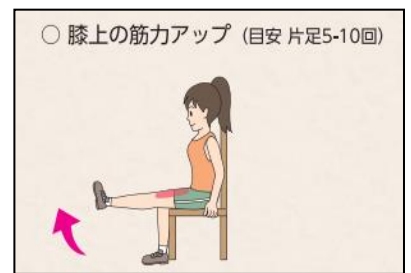
つま先を上に向け、膝が曲がらないようにゆっくり足を伸ばして5秒保つ