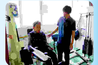
作業療法士 マシンを使ったリハビリ