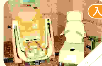
車椅子の方も安心の特殊浴槽

自慢のお風呂 初春は「松の湯」 初夏は「しょうぶ湯」 秋には「みかん湯」 初冬には「ゆず湯」などで楽しんで頂いています。 心身ともに温まるお風呂を楽しみ、癒しのひとときで満足して頂いています。 … 極楽、ごくらく