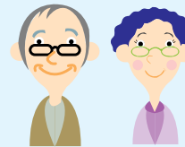
園芸療法士 作品づくり