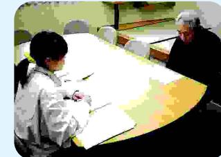
言語療法士 言語のリハビリ