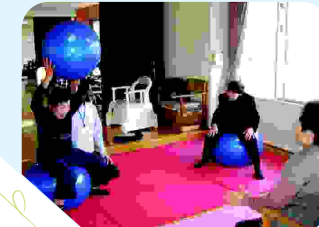
理学療法士 ボール体操