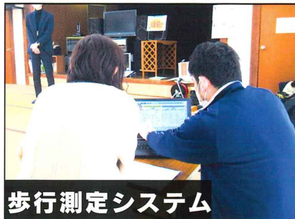
歩行測定システム

中学生がお年寄りの身体と心を実感する授業を阿戸中学校で開催。生徒からは「手足が曲がりにくく階段が怖い」「気持ちが分かったので祖父母にやさしくしたい」の声が聞かれました。